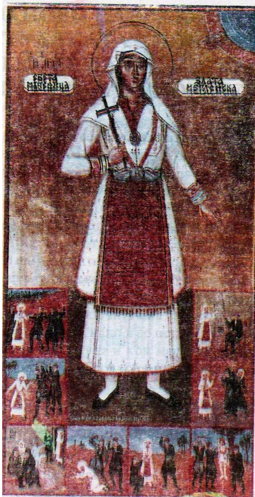
Свѣта маченица Златѣа Мегленска