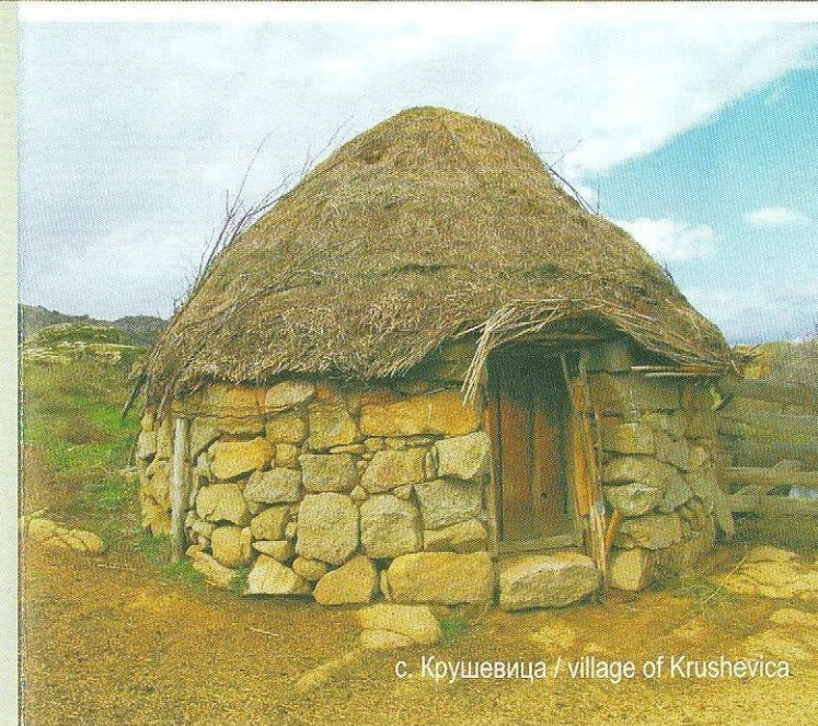
с. Крушевица / village of Krushevica

Although dilapidated, these buildings have kept enough of the code that we must decipher, keep and propagate as part of ourselves, of our roots and existence. It gives additional value to architecture and gives us the right to call it part of the Macedonian heritage. The first thing one will notice when visiting Mariovo is the unity of the man-made structures and the natural surroundings. It gives the environment a special value and magic and is one of the most important characteristics of our traditional architecture. It can also be observed from the standpoints of rurality and the materials used in the construction. Here one has abundance of space which can be used freely, satisfying everybody's needs. The scarcity of space has never dictated the conditions for building. It has been more important to locate the objects in a way they fit in the terrain. The relief here is mainly hilly, so the houses are located far from each other just enough to have room "to breathe".