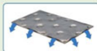
Τομή Θερμαντήρα εναλλάκτη