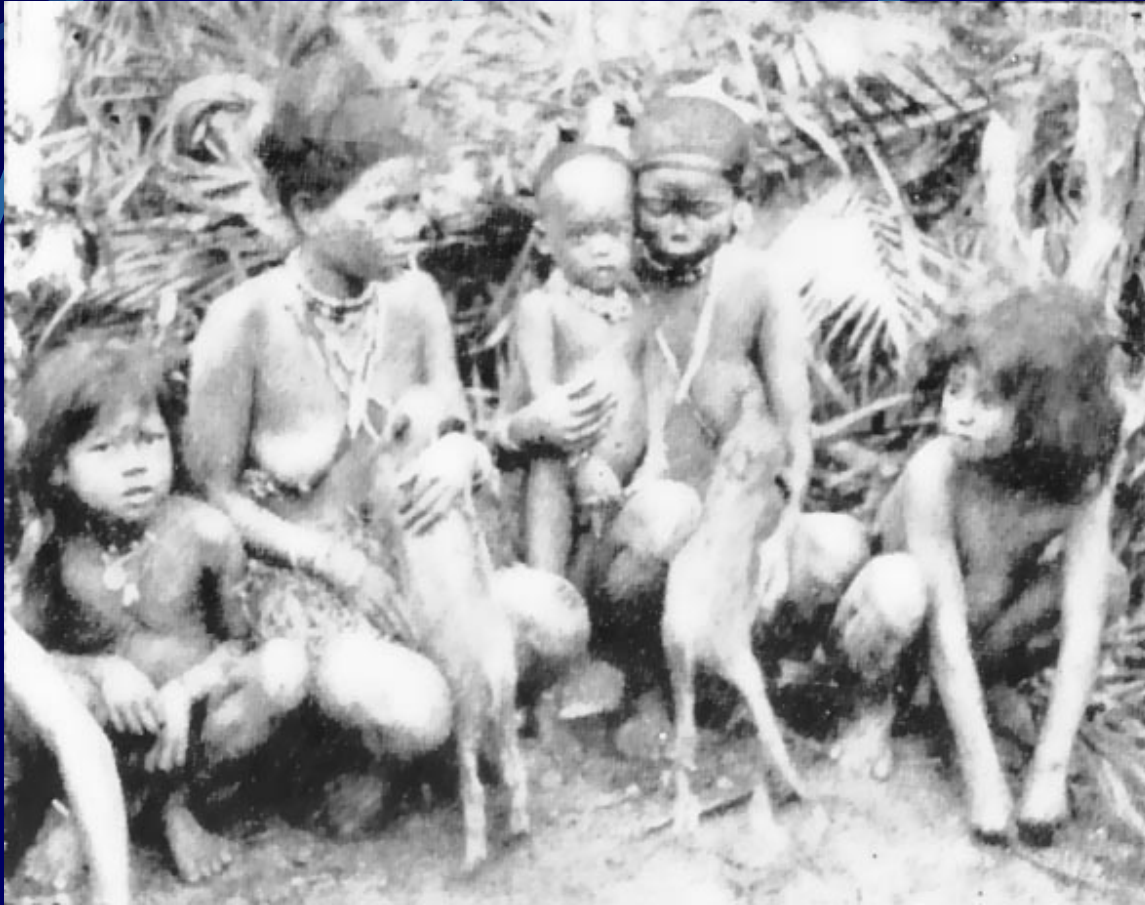
Sakai žene doje mladu divlju prasad