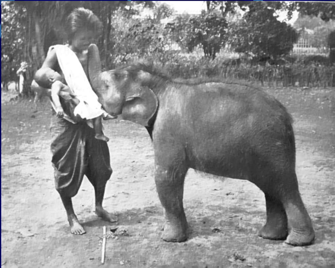
Žena iz Sijama doji mladog slona